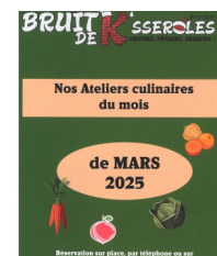
Aurillac Cantal 15